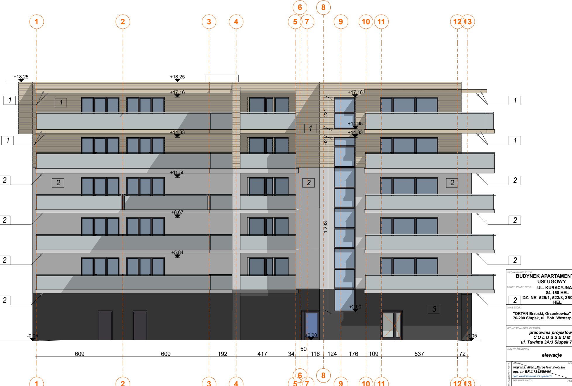
1:100 E-03 Elewacja PD ZACH 1:100