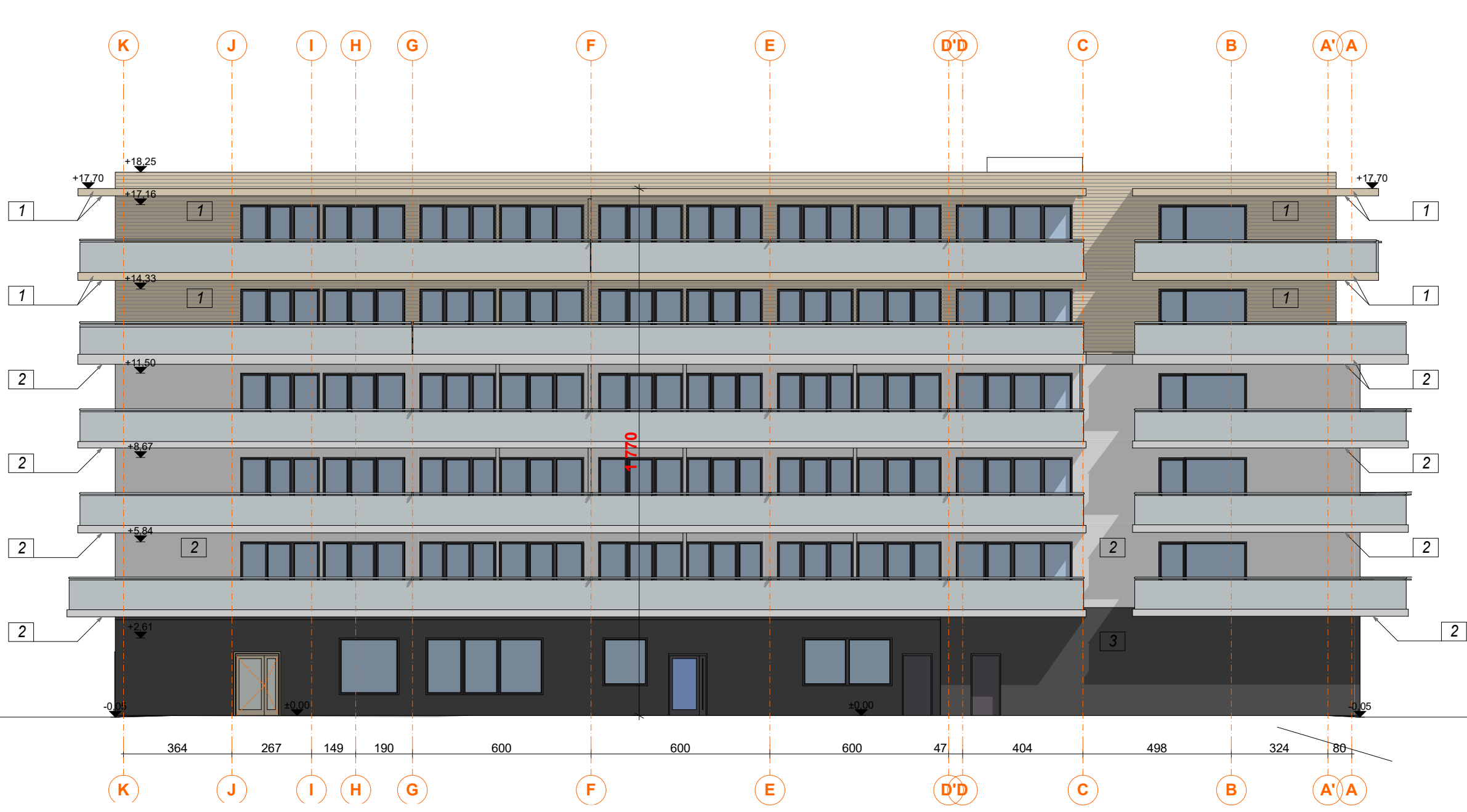
E-02 Elewacja PD WSCH