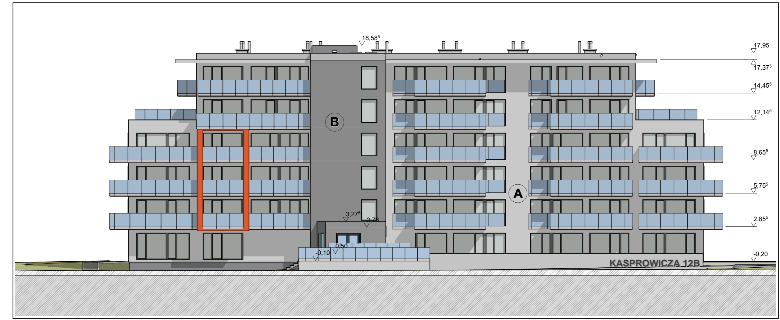
SKALA 1:200 POLNOCNA ELEWACJA