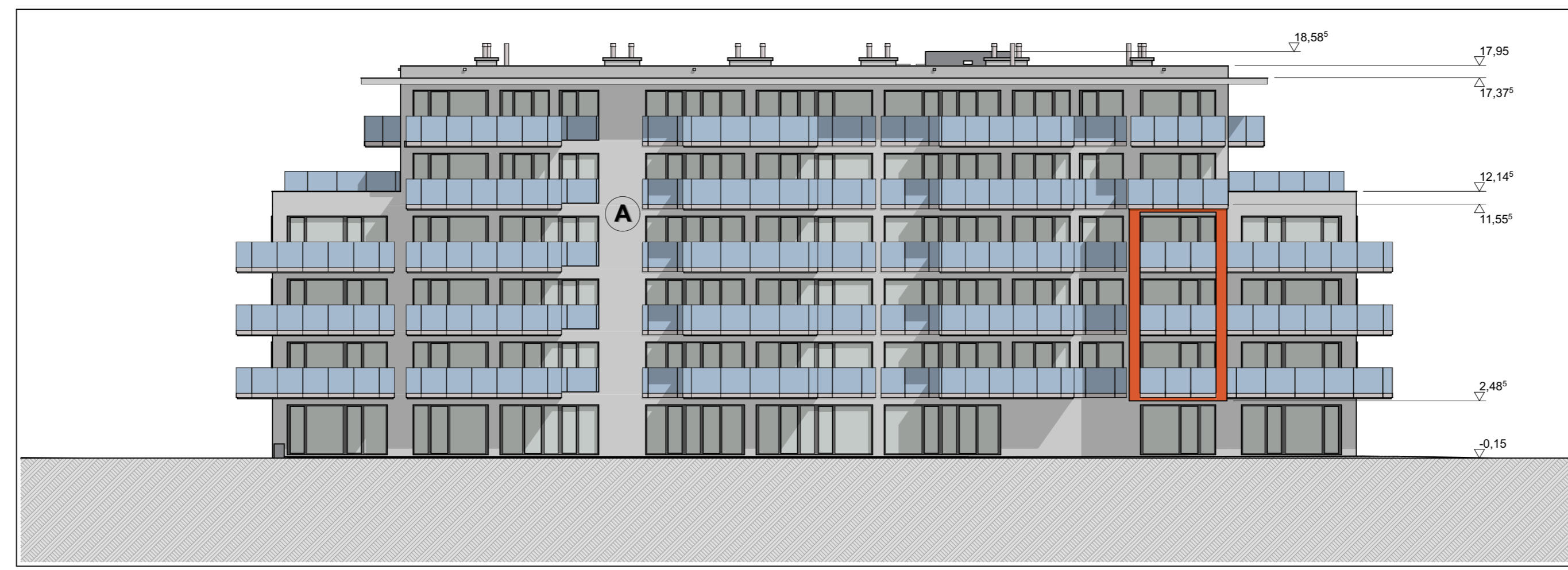
SKALA 1:200 POLUDNIOWA ELEWACJA